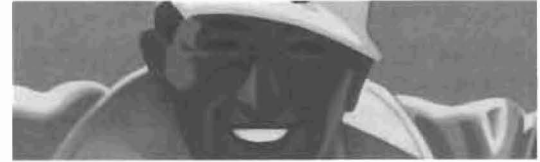
Die Erfindung des Wintersports 170

Achim Steiner Von Bali nach Kopenhagen und darüber hinaus 164