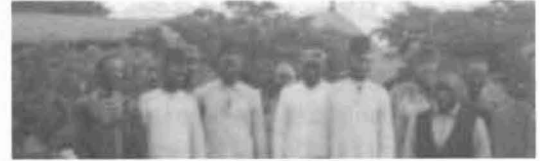
Ostafrika-Expedition des Meteorologischen Observatoriums Lindenberg, 1908 158

Hartmut Graßl Klimawandel und Klimapolitik: Daten, Szenarien, Fragen 154