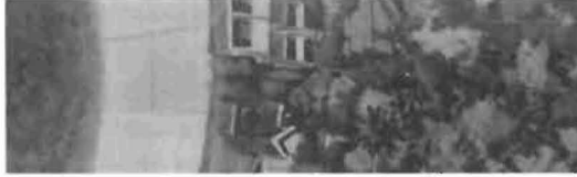
Utopische Klimate 116

Florian Rötzer Globale Technik für den globalen Klimawandel. Die Großprojekte des Geoengineering zur Rettung des irdischen Klimas 120