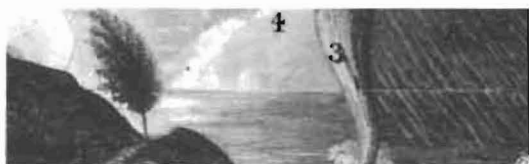
»Diagram of Meteorology« 2