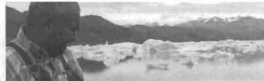
Zeugen des Klimawandels 149

Spencer R. Weart Kurze Geschichte der Entdeckung der Erderwärmung 144