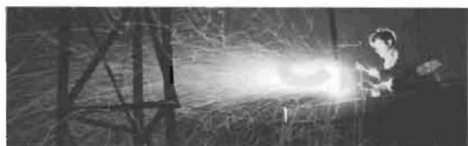
Das »Project Cirrus« 62

Christian Pfister Von der Hexenjagd zur Risikoprävention. Reaktionen auf Klimaveränderungen seit 1500 56