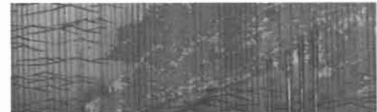
Wetter in japanischen Farbhholzschnitten 214