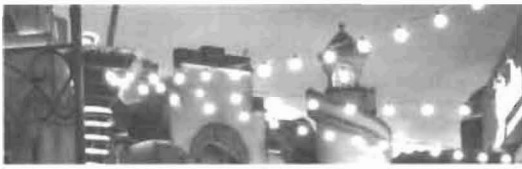
Künstliche Klimate 104