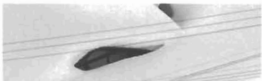
Schnee und Eis 50

Ulrike Brunotte Die Bühne der Götter. Figurationen religiöser Meteorologie 43