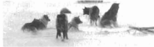
Historische Polarforschung 138

Spencer R. Weart Kurze Geschichte der Entdeckung der Erderwärmung 144