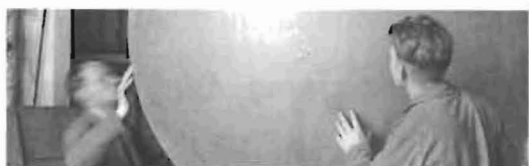
Meteorologisches Observatorium Lindenberg 81