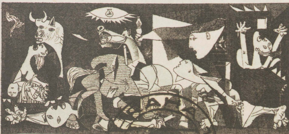
PABLO PICASSO - GUERNICA - 1937 (782 x 351 cm)