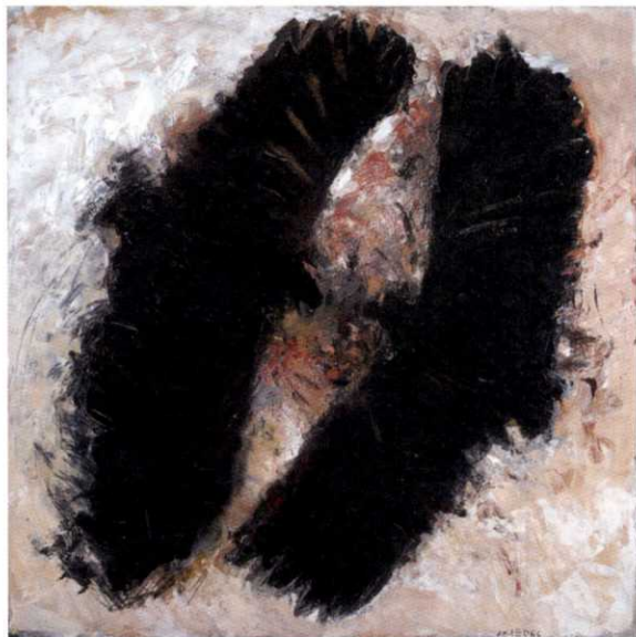
Lutz Friedel, Adler (Die Brüder) , 1989, Öl auf Bitumen und Plastikteile auf Leinwand, 220 × 220 cm, Privatbesitz, Foto: InGestalt / Michael Ehrhrt, © VG Bild-Kunst Bonn, 2019

Oliver Zybok Frank Nitsche DIE EROTISCHE KOMPONENTE 174