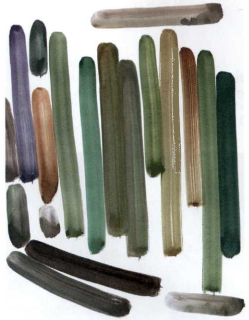
Silvia Bächli, Ohne Titel (sb2018_095) , 8-teilig, 2018, Gouache, Sammlung Troisgros, Ouches/Frankreich, Courtesy Peter Freeman Inc. New York, © Silvia Bächli – S.263

Warren Neidich Rumor to Delusion Zuecca Project Space, Venedig von Ann-Katrin Günzel 275