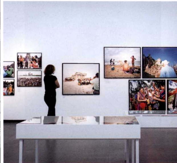
Ausstellungsansicht Martin Parr Retrospektive NRW-Forum Düsseldorf