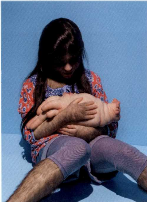
Patricia Piccinini, Litter , 2010, Installation, Installationsansicht: The Coming World: Ecology as the New Politics 2030–2100 , Ausstellung im Garage Museum of Contemporary Art, Moscow, 2019, Foto: Alexey Narodizkiy, © Garage Museum of Contemporary Art – S.287

Monica Bonvicini I Cannot Hide My Anger Belvedere 21, Wien von Petra Noll-Hammerstiel 273