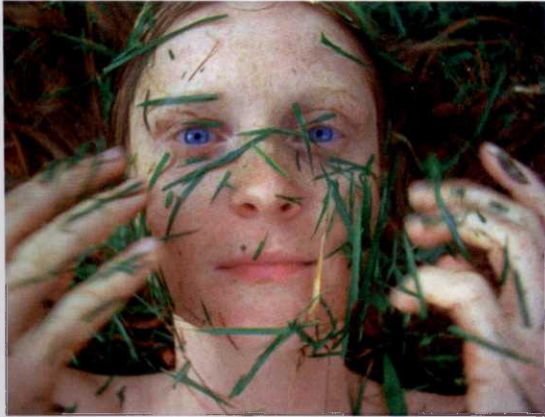
Pipilotti Rist, Homo sapiens sapiens , 2005, Audio-Video-Installation (Videostill)